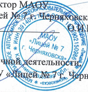
График реализации программы внеурочной деятельности реализуемой на базе Центра "Точка роста" MAOU «Лицей № 7 г. Черняховска»